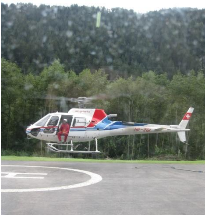
Helikopter bei der Landung

In Tavanasa sind 90% der Aufträge Materialflüge für Lawinenverbauungen. Am liebsten bringe ich Holz oder andere Güter zu Montageorten in den Bergen. Spezialeinsätze der Air Grischa können Auto-Transporte, Seilzüge, Seilbahnevakuationen, Lawinensprengen oder Polizei-, Kontroll- und Feuerlöschflüge beinhalten. Ausserdem sind Film- und Fotoflüge möglich, bei denen professionelle Fotografen die Kunden bei faszinierenden Aufnahmen der Natur unterstützen. Manchmal suchen wir auch nach entlaufenen Gangstern. Eigentlich bieten wir die ganze Palette von Flügen an.